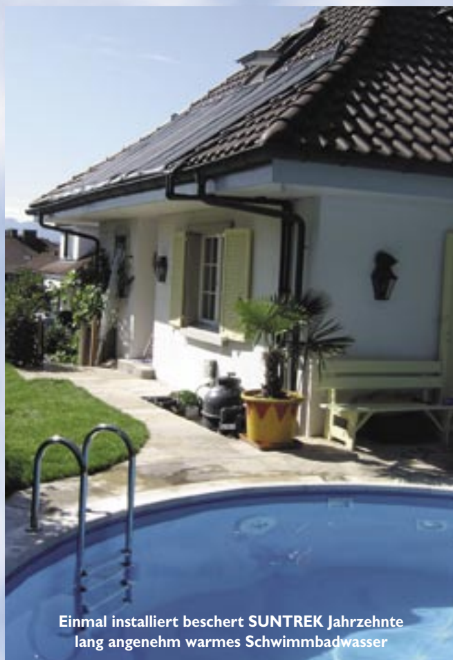
Einmal installiert beschert SUNTREK Jahrzehnte lang angenehm warmes Schwimmbadwasser